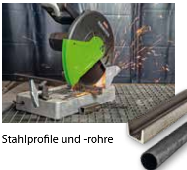
Stahlprofile und -rohre