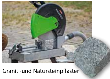
Granit -und Natursteinpflaster