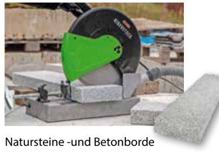
Natursteine -und Betonborde