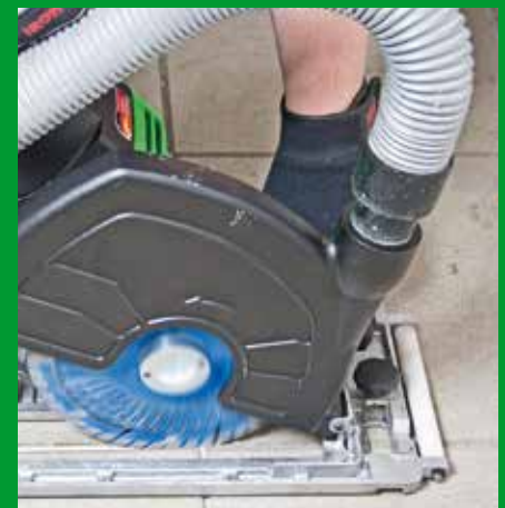
Fugensanierung hier: Trockenschnitt mit Eintauchtiefenbegrenzung