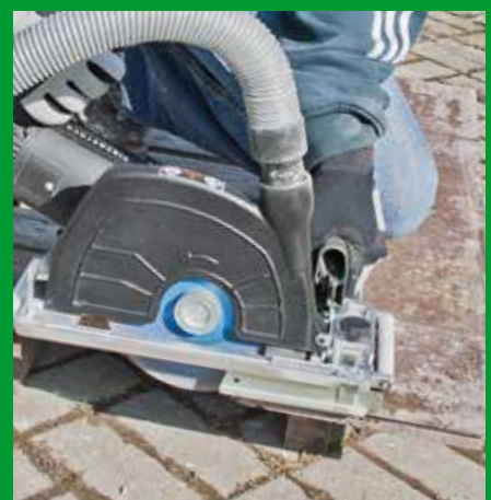
Betonborde im Galabau hier: Trockenschnitt