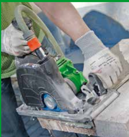
Naturstein-Setzstufe kürzen hier: Nassschnitt mit Winkelanschlag

Winkelanschlag – einfaches Ablängen unabhängig der Werkstückgröße