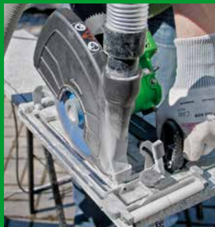
Natursteinfensterbank – Tropffuge hier: Trockenschnitt mit Eintauchtiefenbegrenzung