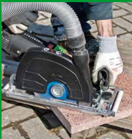
Betonwerkstein – Terrassenplatten hier: Trockenschnitt