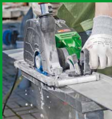
Naturstein-Küchenarbeitsplatte ablängen hier: Nassschnitt mit Führungsschiene