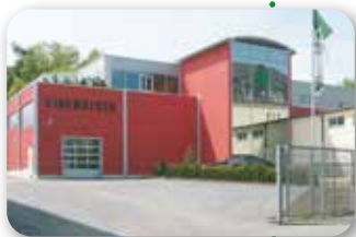
Hochregallager mit Verwaltung