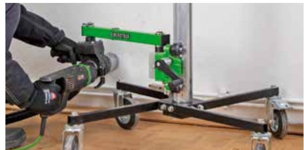
Serienbohrungen beim Dosen senken