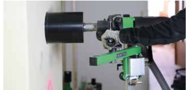
Kernbohrung für den Kaminanschluss