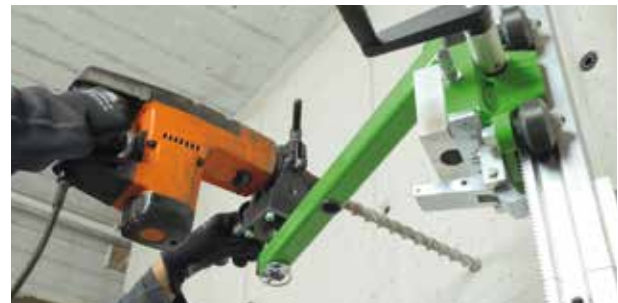
Exaktes Bohren, auch mit Fremd Fabrikaten