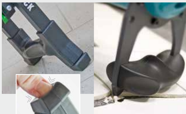
Dämpfungs- und Schutzelemente aus Polyurethan – Schutz der Maschine und des Untergrundes im Falle eines unbeabsichtigten Sturzes