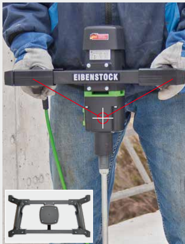
Breite, ergonomische Rahmengriffe in Trapezform und ausgewogener Schwerpunkt – leichtes, ausbalanciertes Führen der Maschine, größere Hebelwirkung