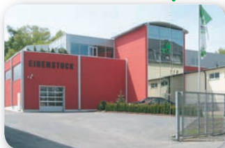
Hochregallager mit Verwaltung