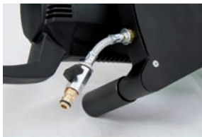
ETR 350 P: INTEGRIERTE WASSERZUFÜHRUNG MIT DURCHFLUSSREGLER Feineinstellung der Wassermenge und staubarmes Arbeiten im Nassverfahren